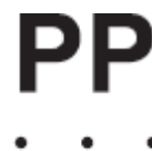
sigla di identificazione del macello

Il macello appone un timbro a fuoco recante la sigla PP (Prosciutto di Parma) e l'identificativo dello stabilimento di macellazione.